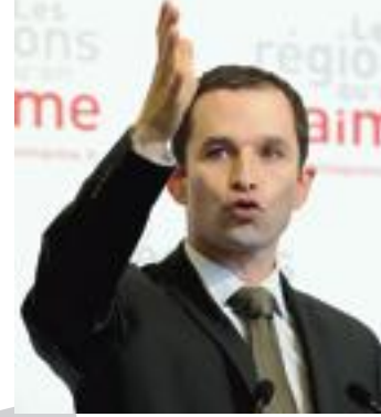
Benoît Hamon voit dans l'entaille faite au bouclier fiscal un « leurre » pour « faire passer la pilule ».

peut-être la Coupe du monde de foot, pour que les gens n'aient pas le temps de réagir », a accusé le maire de Lille.