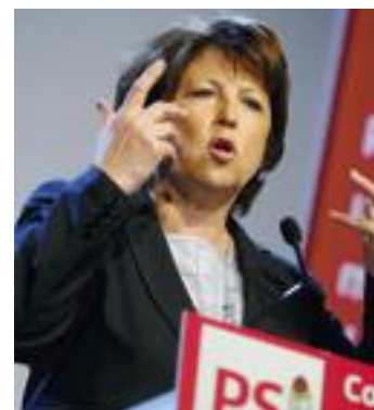
Pour Martine Aubry, la première secrétaire du PS, « on assiste à un simulacre de concertation »

« On attendait un projet, on a des orientations » du gouvernement dont « la piste principale est le recul de l'âge légal ou l'allongement de la durée de cotisation », a insisté Benoît Hamon, le porte-parole du PS. Le gouvernement croit que la pilule passera si l'on utilise le leurre de la mise à contribution des revenus financiers. Mais cette mesure « n'est pas chiffrée », « ne remet pas en cause le bouclier fiscal » et annonce « homéopathique », a déploré le leader de l'aile gauche du parti. Même son de cloche du côté de la première secrétaire. « Le gouvernement n'avance pas dans ses propositions », a estimé Martine Aubry. Nous comprenons entre les lignes qu'il souhaite comme d'habitude faire payer les salariés et les retraités. On assiste à un simulacre de concertation. [...] On a l'impression que le gouvernement veut attendre l'été,