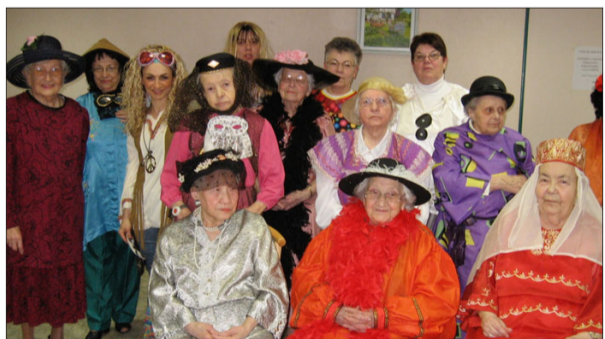
Viva Carnaval pour les pensionnaires du Foyer Couronne invités mardi à cette festivité en... costumes. Si tous les résidents n'avaient pas opté pour le déguisement de circonstance, l'ambiance autour des tables était aux couleurs du sourire et de la convivialité.