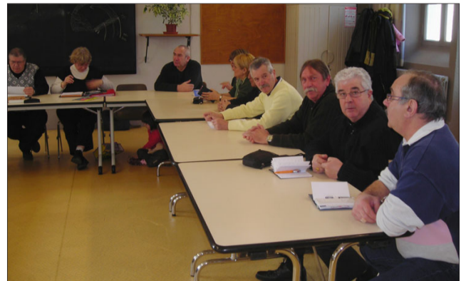
La réunion a permis d'aborder le calendrier des activités 2010.

Dimanche matin s'est tenue salle Saint-Henri une réunion de l'amicale de la classe 69 du Creusot.